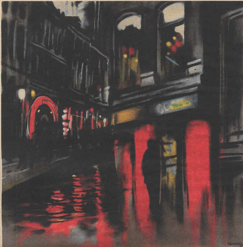
Faith71, 'Red Life Painting no. 3', spuitsbus op mdf-plaat.

Veel collega's van Faith71 hantieren de spuitsbus niet meer, maar wel groeiden ze bijna allemaal op met